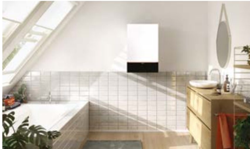
Vitodens 200-W au design attrayant en couleur Vitoppearlwhite

Vitodens 200-W est la chaudière murale gaz à condensation idéale pour les appartements en propriété ou les maisons individuelles. Elle s'installe facilement dans une niche de la salle de bain ou dans un placard de la cuisine. Vitodens 200-W est équipée d'un échangeur de chaleur Inox-Crossal en acier inoxydable de haute qualité. Elle garantit fiabilité et condensation durablement élevée. Cela s'applique également au brûleur Matrix-Plus.