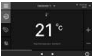
Nouvel écran tactile à différents niveaux de gris de 7 pouces

Vitodens 200-W est commandée via un écran tactile à différents niveaux de gris de 7 pouces ou via un écran noir et blanc de 3,5 pouces avec affichage en texte clair et graphique, assistants de mise en service, affichage des consommations d'énergie et commande alternative avec un appareil mobile.