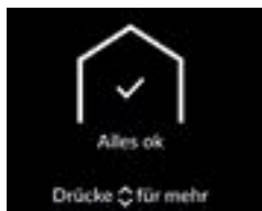
Écran standard 3,5 pouces