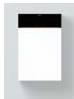
Vitodens 200-W Types B2HF/B2KF

Utilisation confortable à hauteur des yeux grâce à l'écran déplaçable vers le haut