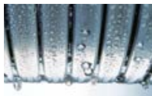
Échangeur de chaleur Inox-Radial

L'acier inoxydable fait la différence. L'échangeur de chaleur Inox-Radial en acier inoxydable résistant à la corrosion est le cœur de la Vitodens 200-W. Il transforme l'énergie utilisée en chaleur de manière particulièrement efficace. Pratiquement sans perte, avec un rendement difficilement égalable de 98%. Et ce, en toute sécurité grâce à l'acier inoxydable de haute qualité et particulièrement durable.