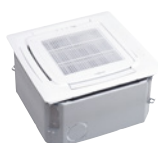
Cassetta da soffitto