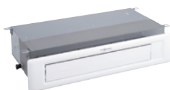
Unità interna per il montaggio in canale, bassa pressione di erogazione, con copertura/pannellatura