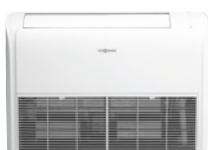
Unità interna per il montaggio a pavimento e a soffitto