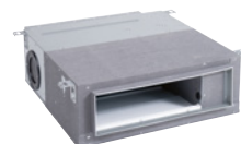
Unità interna per il montaggio in canale, pressione di erogazione media