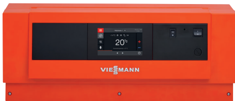
Vitotronic Regelung mit Farb-Touch-Display