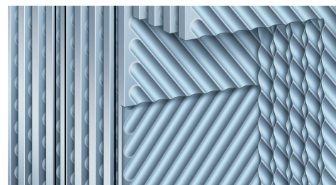
Inox-Crossal-Wärmetauscherfläche für hochwirksame Wärmeübertragung und Kondensationsrate

Die hochwirksame Wärmeübertragung und die hohe Kondensationsrate ermöglichen Norm-Nutzungsgrade bis 98 Prozent ( H_g ). Diese Werte werden durch das Gegenstromprinzip von Heizgas und Kesselwasser sowie die intensive Verwirbelung der Heizgase durch die Heizfläche erreicht.