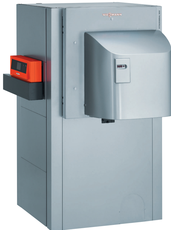
Vitocrossal 300 mit einer Nenn-Wärmeleistung von 400 bis 630 kW

Bewährter Gas-Brennwertkessel mit MatriX-Zylinderbrenner, Inox-Crossal-Wärmetauscherfläche und einfach zu bedienender Regelung Vitotronic