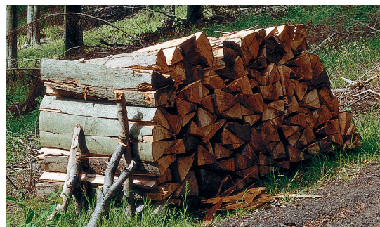
Le chauffage au bois - le combustible le plus naturel au monde

Un dispositif automatique de montée en température permet d'atteindre, trois minutes après le démarrage, la température nécessaire pour une combustion optimale. A l'intérieur de la cuve, les bûches de bois se transforment en braises. Les gaz formés sont aspirés, enrichis en oxygène et brûlés à des températures élevées de manière propre et avec de faibles dégagements polluants. Un dispositif d'allumage automatique des bûches de bois est disponible en option. La mise en marche de l'allumeur est programmable au travers de la régulation.