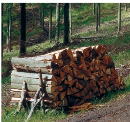
Bûches de bois