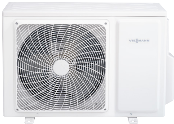
Vitoclima 300-S Inneneinheit und Außeneinheit