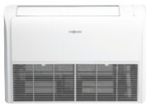
Inneneinheit für die Boden- und Deckenmontage