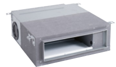
Inneneinheit für den Kanaleinbau, mittlerer Förderdruck