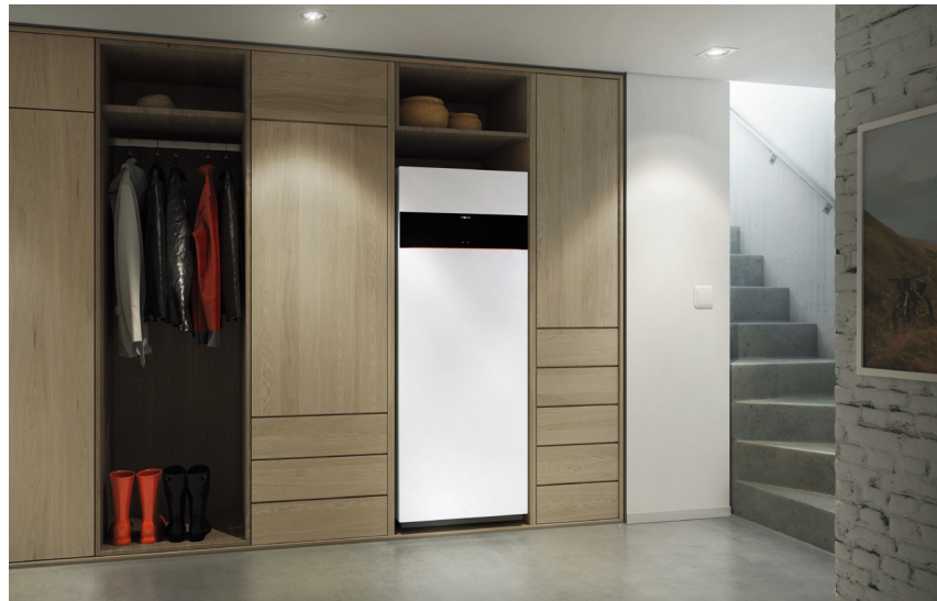
Vitodens 222-F au design attrayant en couleur Vitoppearlwhite

Vitodens 222-F est la combinaison intelligente d'une technique gaz à condensation efficace et d'un confort en eau chaude élevé – facile à utiliser, durable et numérique.