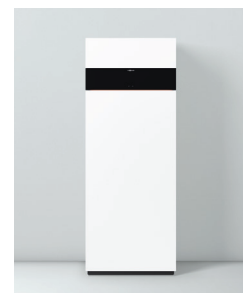
Vitodens 222-F Comfort