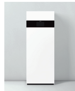
Vitodens 222-F Premium