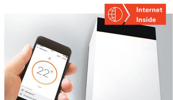
Régulation aisée avec l'application ViCare

Le réglage et l'utilisation sont-ils faciles? C'est l'un des critères les plus importants lors du choix d'un nouveau chauffage. La Vitodens 222-F séduit par son confort d'utilisation exceptionnellement élevé. Elle peut être utilisée très facilement et intuitivement via un smartphone, une tablette ou directement sur l'écran SW de 3,5 pouces (version «Comfort») ou sur l'écran tactile couleur de 7 pouces réglable en hauteur (version «Premium»). L'affichage en texte clair et graphique vous guide à travers tous les points de menu. De plus, le cockpit énergétique permet de garder un œil sur toutes les consommations d'énergie.