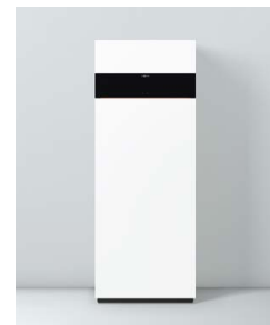
Vitodens 222-F Comfort

Die Geräte sind für Erd- und Flüssiggas nach EN 15502 geprüft und zugelassen. Abweichende Nenn-Wärmeleistung bei Betrieb mit Flüssiggas, siehe Planungsanleitung.