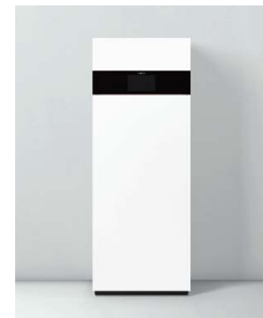
Vitodens 222-F Premium