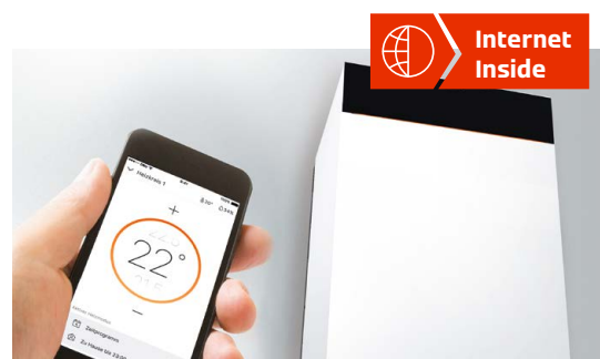
Komfortabel per ViCare App regeln

Wie einfach ist die Einstellung und Bedienung? Das ist eines der wichtigsten Kriterien bei der Entscheidung für eine neue Heizung. Vitodens 222-F begeistert durch seinen aussergewöhnlich hohen Bedienkomfort. Er lässt sich über Smartphone, Tablet oder direkt am 3,5 Zoll SW-Display (Ausführung Comfort) oder am 7 Zoll Farbtouch-Display (Ausführung Premium) ganz einfach und intuitiv bedienen. Klartext- und Grafikanzeige führen durch alle Menü-Punkte. Und mit dem Energie-Cockpit hat man alle Energieverbräuche im Blick.