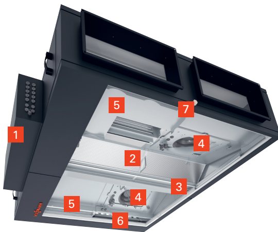
Vitoair FS PRO