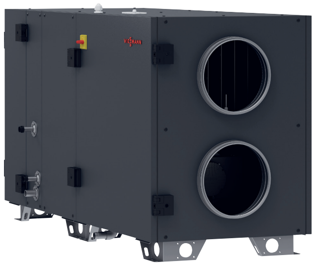
Vitoair CS PRO – zur Innen- und Außenaufstellung geeignet

Vitoair PRO von Viessmann ist eine neue leistungsstarke Lüftungslösung für Büros, Kitas, Shops, Versammlungsstätten und Mehrfamilienhäuser gleichermaßen.