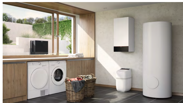
Pompe di calore aria-acqua Vitocal 200-S con sistema di addolcimento dell'acqua potabile Vitaset Aqua installato in basso