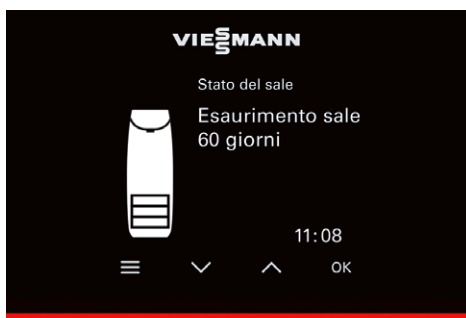
Il display e la Lightguide forniscono informazioni sullo stato di funzionamento attuale.

loro Vitaset Aqua tramite il proprio smartphone. Ad esempio, l'app fornisce una notifica anticipata quando è necessario ricaricare l'addolcitore con il sale in pastiglie. Inoltre, gli utenti possono leggere la portata d'acqua corrente e ricevere avvisi se viene rilevato un potenziale problema. In caso di perdite, la valvola di intercettazione (opzionale) chiude automaticamente l'ingresso dell'acqua nella linea principale per evitare allagamenti e danni all'abitazione. La valvola di chiusura può essere azionata anche tramite l'app ViCare o direttamente sull'addolcitore.