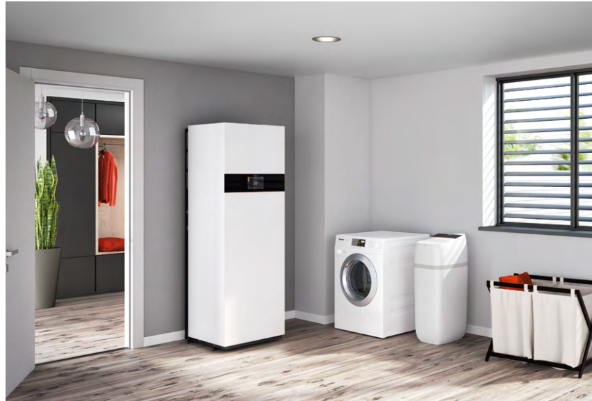
Vitaset Aqua è l'addolcitore che garantisce acqua addolcita e migliora l'efficienza dei dispositivi che utilizzano l'acqua.

Con l'acqua addolcita di Vitaset Aqua è più facile la pulizia dei sanitari e delle stoviglie e assicura lunga vita all'impianto e agli elettrodomestici.