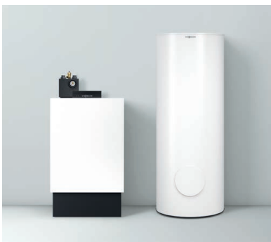
Vitoladens 300-C mit nebengestelltem Speicher-Wassererwärmer Vitocell 300-B/W (Typ EVBB-A, 300 l Speichereinhalt) – beide in der Farbe Vitopearlwhite