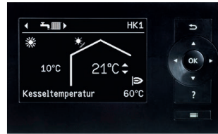
Display der Vitotronic Regelung mit Klartextanzeige und übersichtlicher Menüführung

Mit Vitoconnect und einem Smartphone ist die Bedienung von Viessmann Heizungsanlagen ein Kinderspiel. Mit der ViCare App können Heizungsanlagen gesteuert werden. Alle Apps sind für mobile Endgeräte mit iOS- oder Android-Betriebssystemen erhältlich.